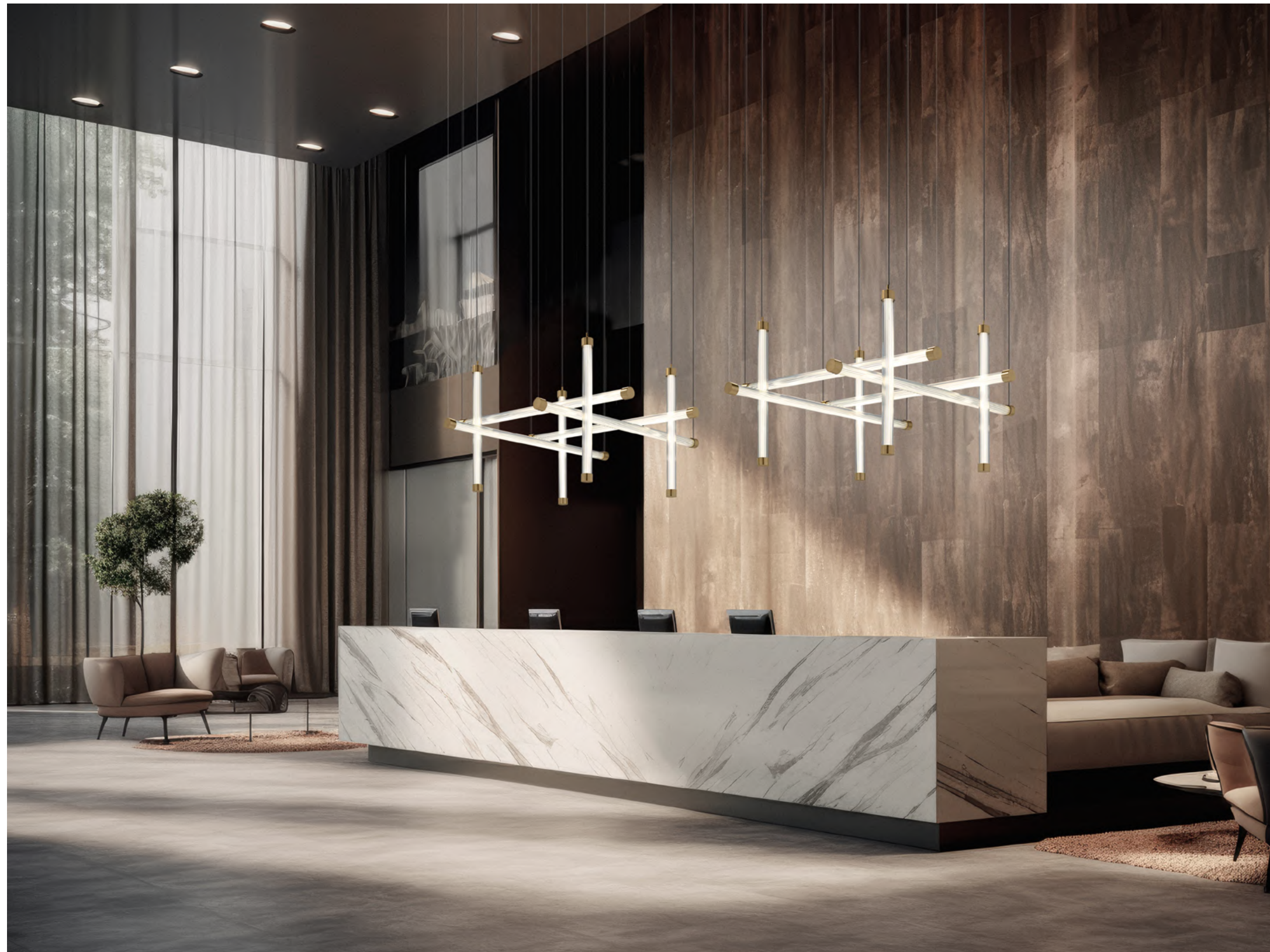
Trama project n°2 S8 Grid