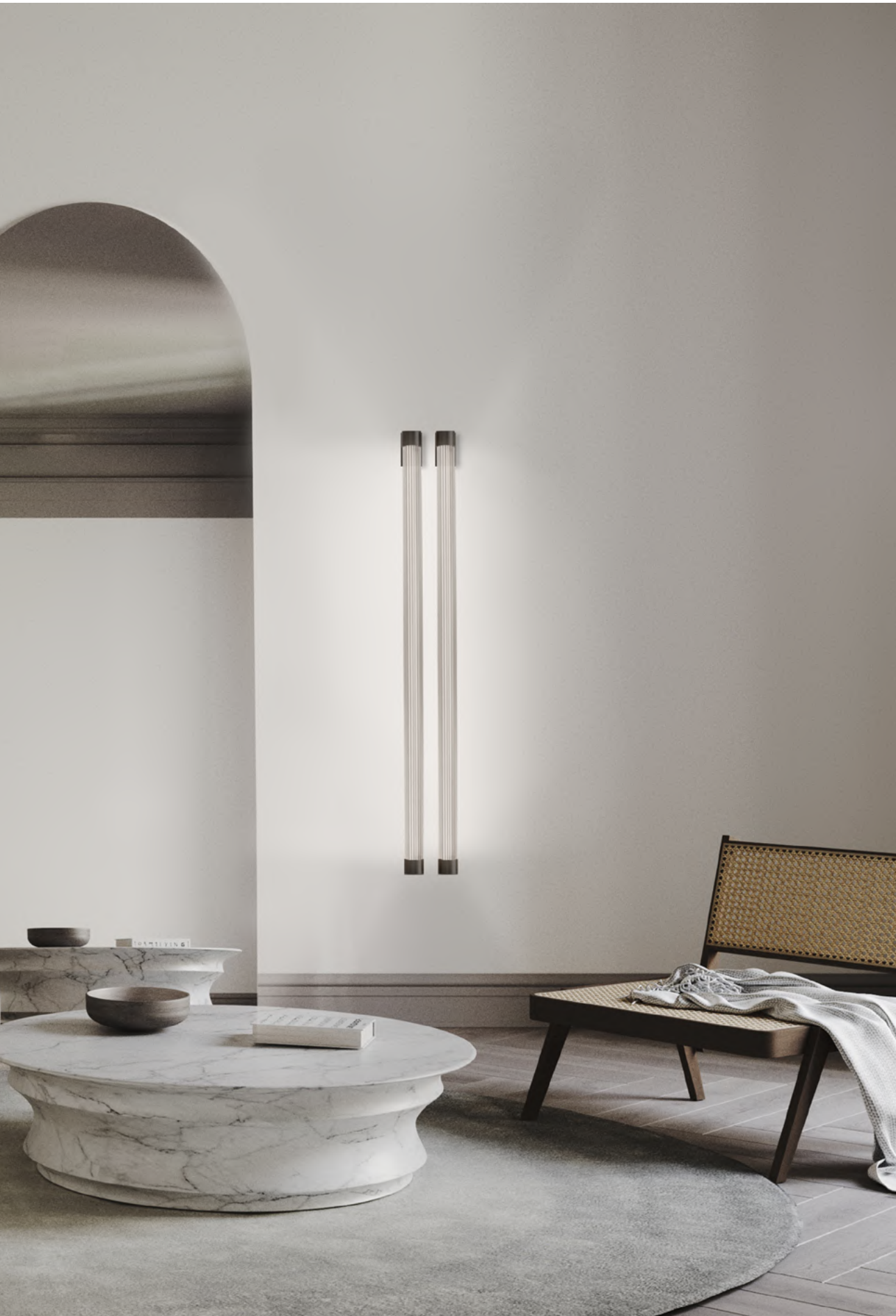
Trama wall lamp 120